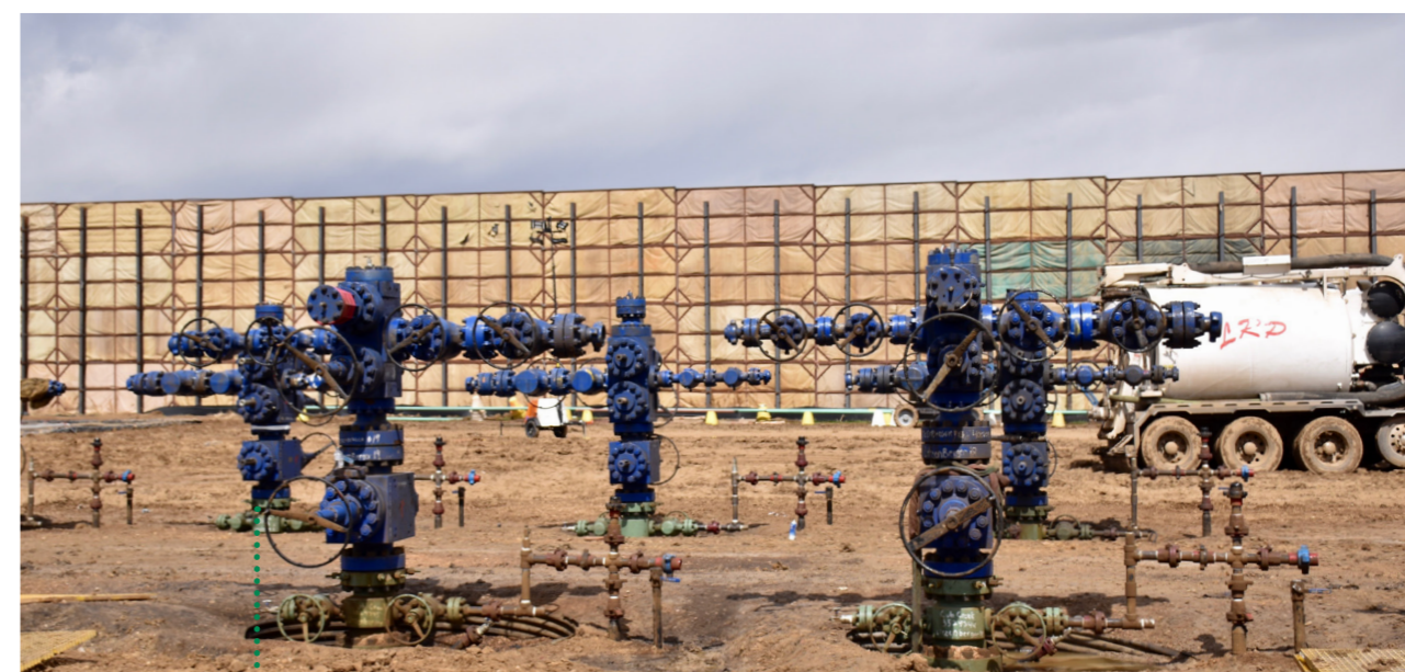
BOHRLÖCHER AUF DEM LITZENBERGER-BOHRPLATZ

Cub Creek Energy stellte im März und April 2018 16 Bohrungen vom Litzberger-Bohrplatz fertig und begann Ende April mit der Produktion. Mitte Juni veröffentlichte Cub Creek die Ergebnisse aus den ersten 30 Tagen stabiler Produktion. Sie lagen bei 5.632 Barrel Öläquivalent bzw. 4.704 Barrel Öl. Es handelt sich um 16 Bohrungen mit einer Meile horizontaler Länge, an denen Cub