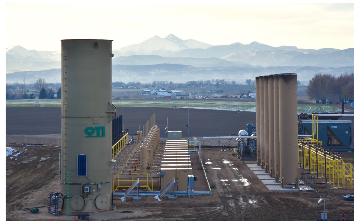
PRODUKTIONSANLAGEN AUF DEM MARKHAM-BOHRPLATZ